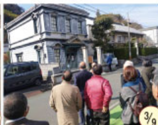
産業交流会 in 八幡浜