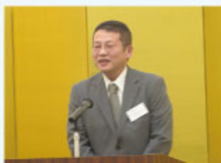
合同会社アンケリアス