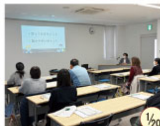
所得税確定申告書作成研修会