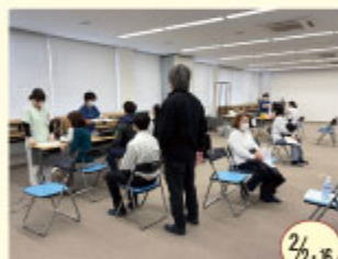
健康管理検査・川之江地区