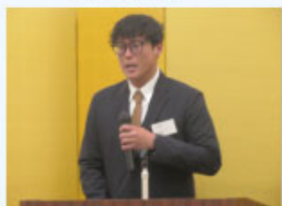
サンガワファーストキャピタル(株)