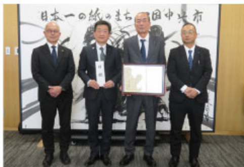
大西賢治市長を囲んで記念撮影