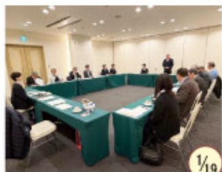
税務署・法人会連絡会